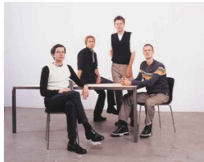
Kreidler. Fotosession für das Album »Weekend« im ehemaligen VHS Gebäude, Mai 1996.

Man muss sich also eine eigene Version davon zusammenbauen. Ich war zwar Punk, aber ich war auch Messdiener. Es gab Leute, die Punk in einer extremen Lebensweise gelebt haben. Das war bei mir nie der Fall. Für mich war klar, dass alles künstlerische Tun mitten im alltäglichen Leben stattfinden muss. Das hatte für mich auch nichts mit »No Future« zu tun. Mit Punk ging das Leben eigentlich erst richtig los, und zwar in einer Form, die ich dann später an der Kunstakademie nochmal begriffen habe: Du bist für dich selbst verantwortlich. Es gibt niemanden, der dir erklärt, dass du arbeiten oder morgens um sieben aufstehen musst. Du musst das alles für dich selbst entscheiden. Das war etwas, wo ich bei Punk vielleicht eine erste Ahnung davon bekam.